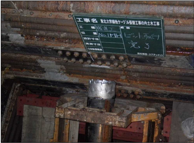
特殊メタル取付完了